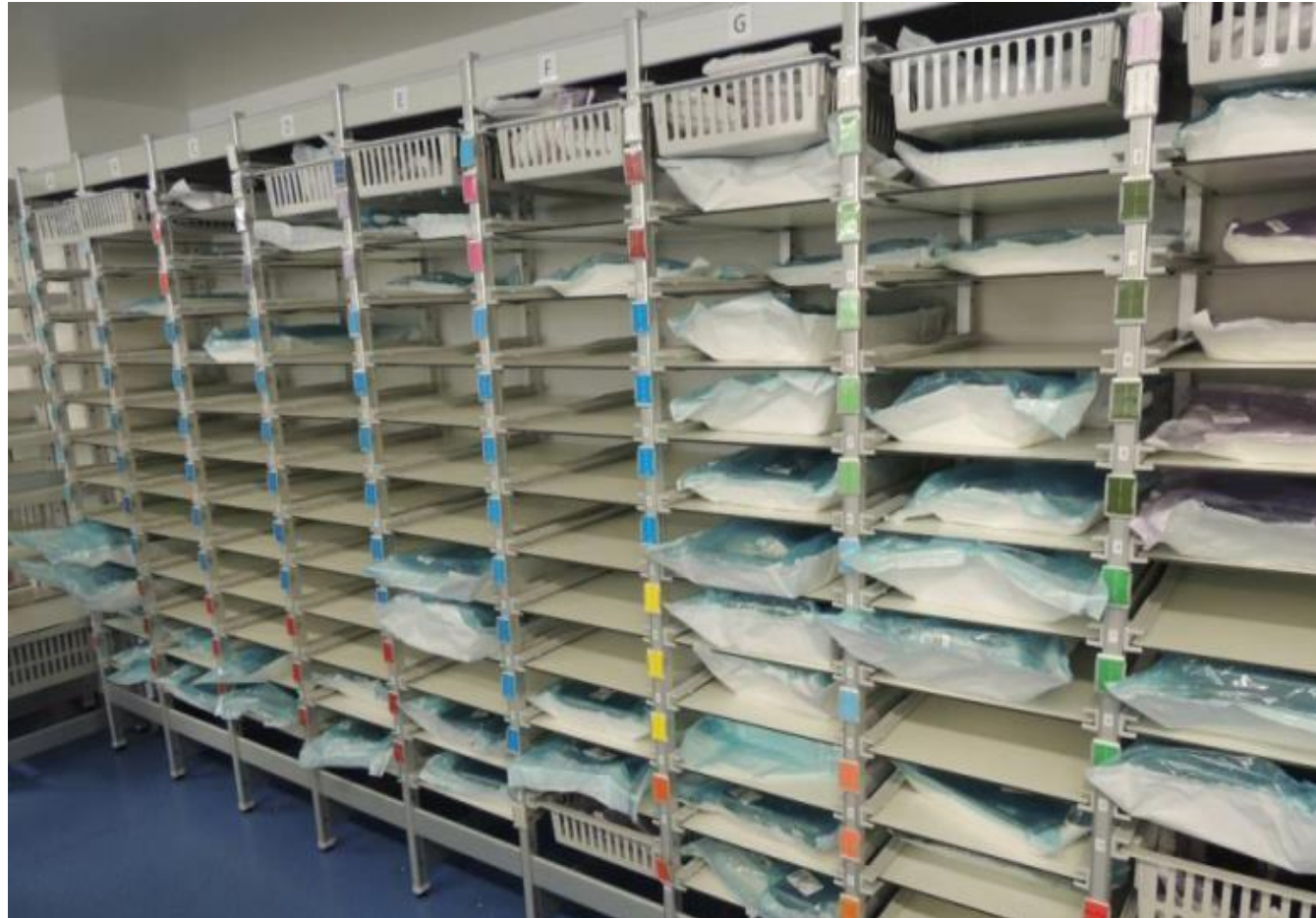
Stockage au bloc opératoire