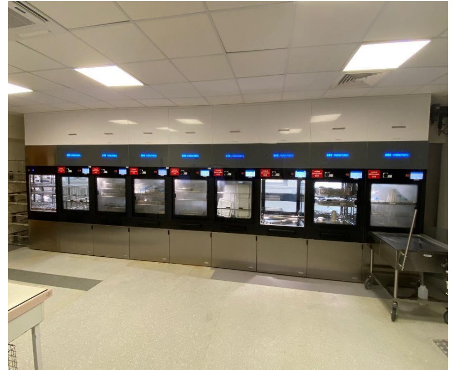
Zone de lavage - site Gaston Cordier